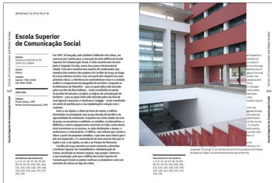
Interior do livro