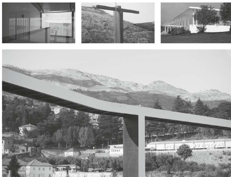
Stills do Vídeo “Estranha Leveza” de Nuno Cera